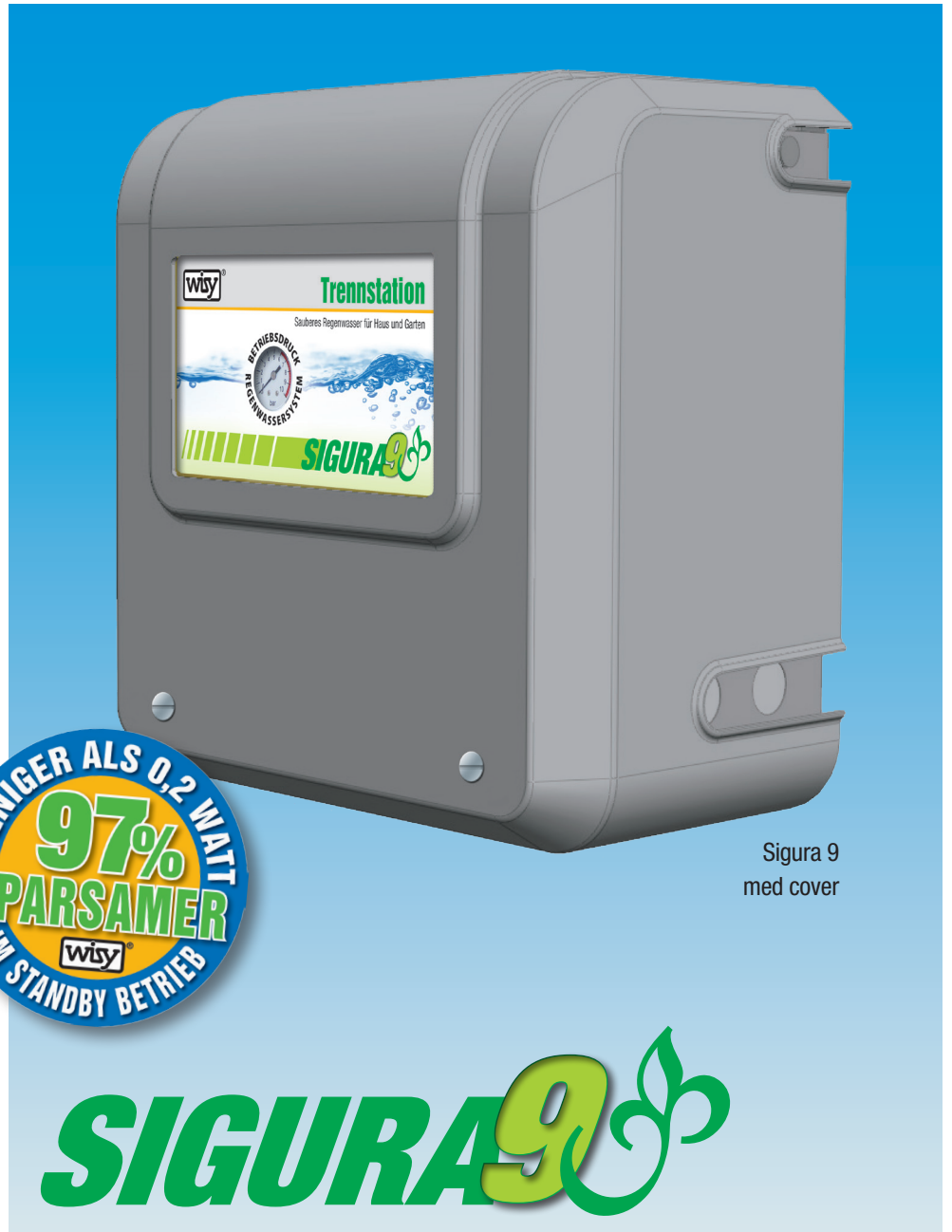
Sigura 9 med cover