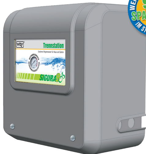
SIGURA 9 med cover

Sikkerhedspumpen SIGURA 9 adskiller aftapningssteder til forbrugsvand fra den offentlige drikkevandsforsyning. Dermed bliver den offentlige drikkevandsforsyning beskyttet mod forurening. Drikkevandsefterfyldningen er udført som frit udløb iht. DS/EN 1717 og DIN 1988-100. Separationstanken SIGURA 9 placeres i et frostfrit teknikrum, forsynes med drikkevand fra det offentlige net og tilfører det under tryk til forbrugsvandsystemet. Sikkerhedspumpen leverer et tryk på op til 4,5 bar til forbrugsvandsystemet. I bygninger på op til tre etager er den også velegnet som trykforøgelsesanlæg. Endvidere velegnet til vandingsanlæg, vaskeanlæg, kvægdrikkeanlæg og generelt til alle anvendelser, hvor direkte tilslutning til drikkevandsforsyningen ikke må finde sted.