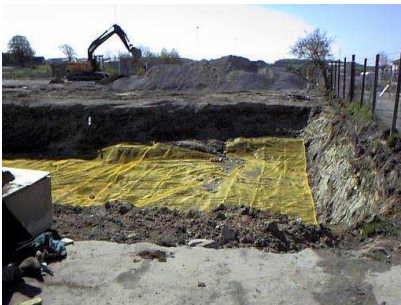
Markering af skillelag